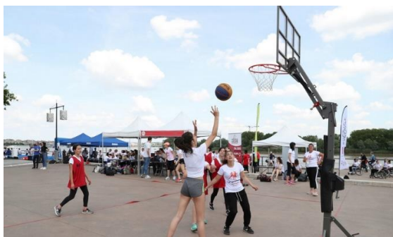
Une animation « Sportculture 21 th » à Montpellier